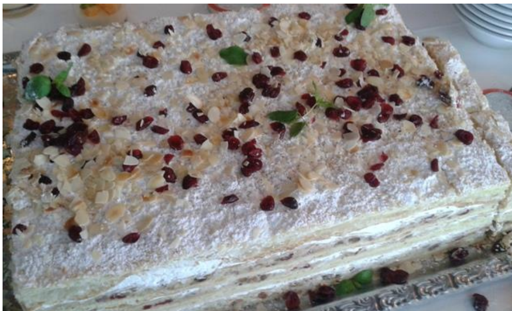
Torta Katarina Zrinski